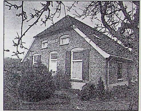
Voormalig Hissinkhuis Het Werfslag aan de Broekstraat op de gemeentegrens Doetinchem-Zelhem.

lem Hissink, die uit Baak of Steenderen kwam, aanvankelijk Jansen op Hissink werd genoemd en in 1758 zijn zoon Wessel Hissink noemde.