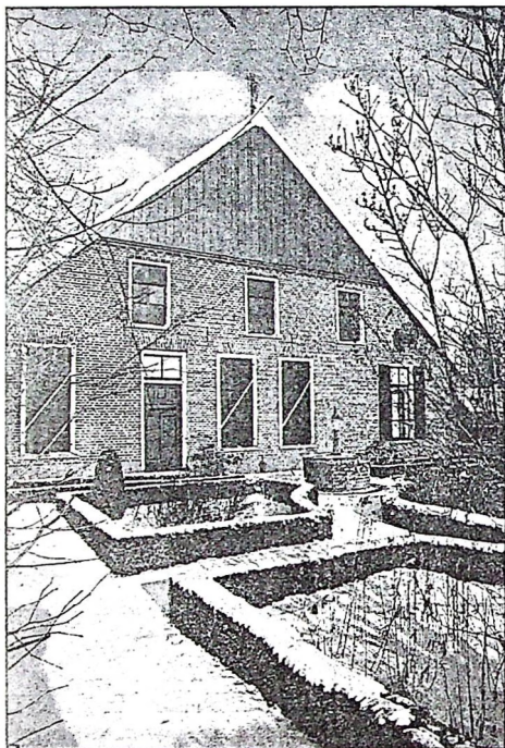
♦ Het stamhuis Hoebink aan de Hoebinkweg 4 in Meddo.

De naam Hoebink valt uiteen in vier takken, waarvan de eventuele onderlinge verbanden tot dusver nog niet zijn gevonden. Doordat de naam vroeger van boerderij op bewoners overging, is ook niet waarschijnlijk dat alle Hoebinks vanouds elkaars bloedverwanten zijn. De tak Meddo lijkt de oudste rechten te hebben. De boerderij- en familienaam zal wel afkomstig zijn van de voor-naam Hubert of Hobbe.